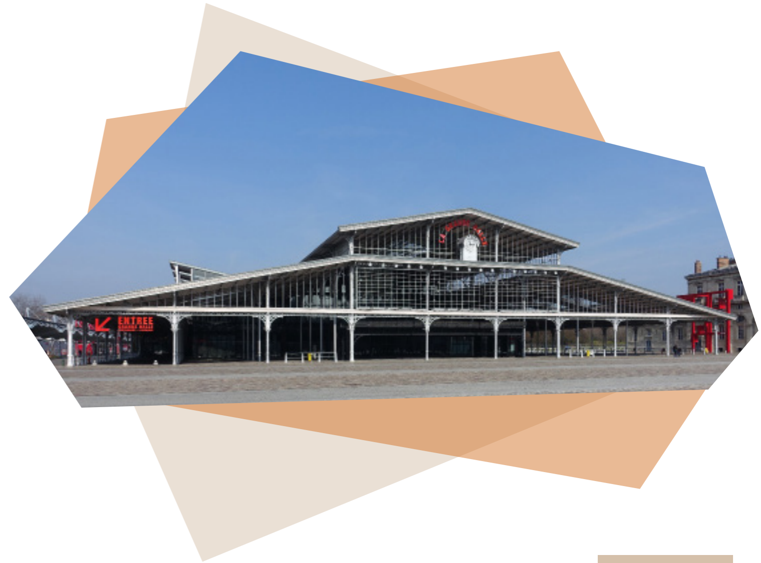
La Grande Halle de la Villette

C réé en 1903 dans le but de promouvoir les avant-gardes et les esprits novateurs de leur époque, le Salon d'Automne continue à défendre une variété de styles et d'artistes et se concentre à mettre en avant une grande partie de la création contemporaine. Ce rendez-vous historique de l'art contemporain continue d'encourager la modernité dans l'art français et à l'étranger en fédérant près de 1000 artistes dans une exposition annuelle. Le Salon d'Automne est incontestablement le promoteur de tous les arts, sans distinction de hiérarchie en France et à l'international.