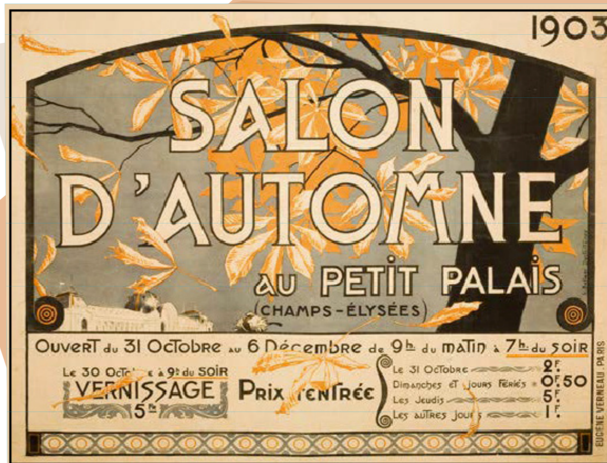
Affiche du salon 1903