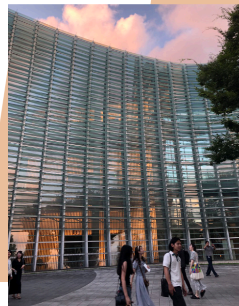
National Art Center de Tokyo

Avec l'Allemagne, le projet Amplitude du BBK organisé par Georg Schnitzler et Victor Sasportas a déjà donné lieu, avec succès, à deux importantes expositions à Cologne en 2022 : une quarantaine d'artistes, français, allemands et polonais y ont participé. La troisième exposition s'est tenue en Pologne en juillet et en novembre 2023. Un nouveau projet en 2024, pour lequel la Tchécoslovaquie et les Pays-Bas se joindront au groupe déjà constitué par des artistes français, allemands et Polonais.