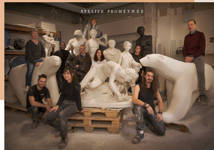
François pompon 1855-1933 sociétaire du Salon d'Automne de 1922 à 1932